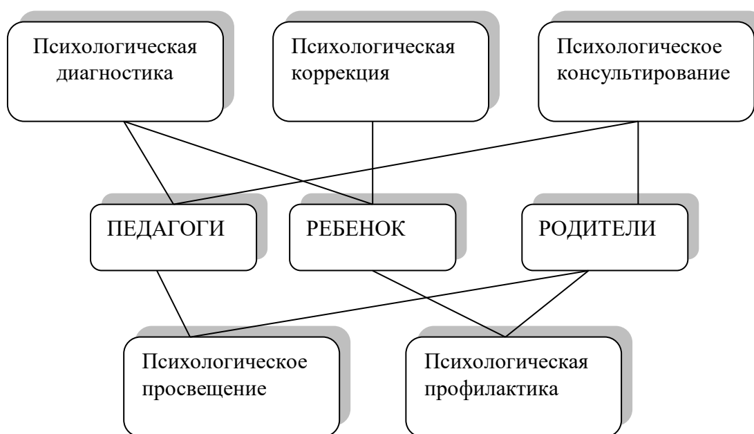
Схема психологического сопровождения участников образовательного процесса

Деятельность педагога-психолога ДОУ регламентирована профессиональным стандартом «Педагог-психолог (психолог в сфере образования)», утвержденным приказом Минтруда России от 24.07.2015 г. № 514н. Данный приказ определяет основные направления работы (трудовые функции) педагога-психолога и их содержание.